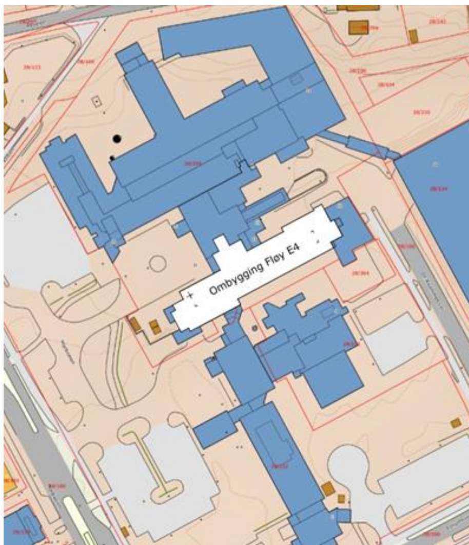
Figur 1 - Plassering av Fløy E4 som del av Klinikk Alta